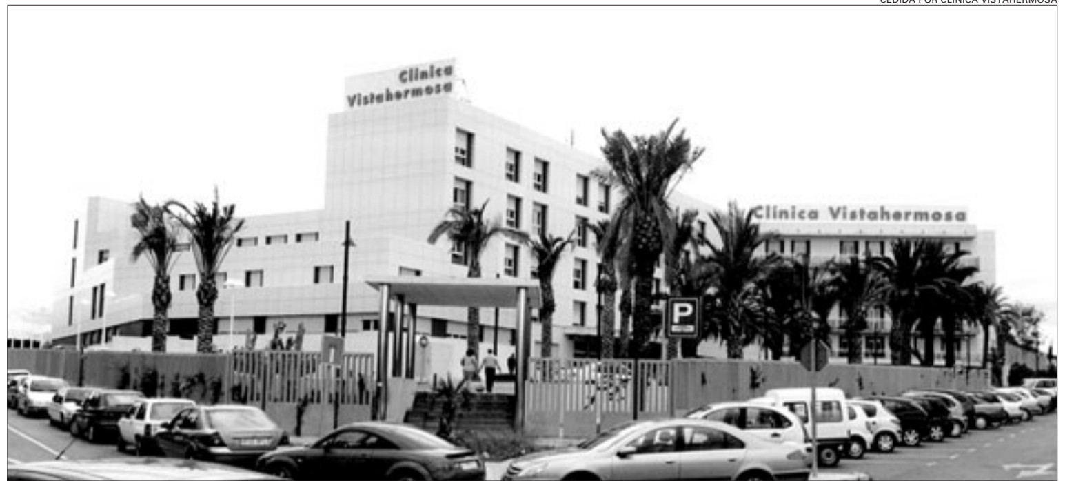
Actualmente la Clínica Vistahermosa de Alicante se conforma como un centro médico-quirúrgico moderno, dotado de una tecnología avanzada