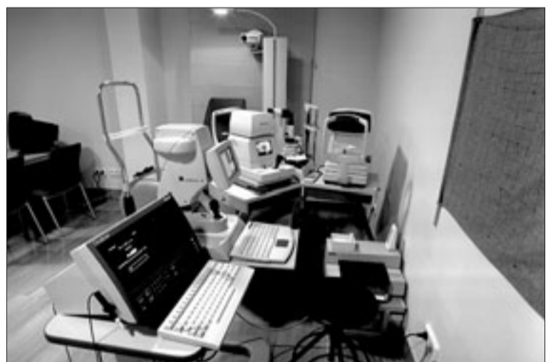
El carácter maternal e infantil de los inicios del centro contrasta con la amplia atención actual a todo tipo de enfermos. Imágenes de algunos servicios