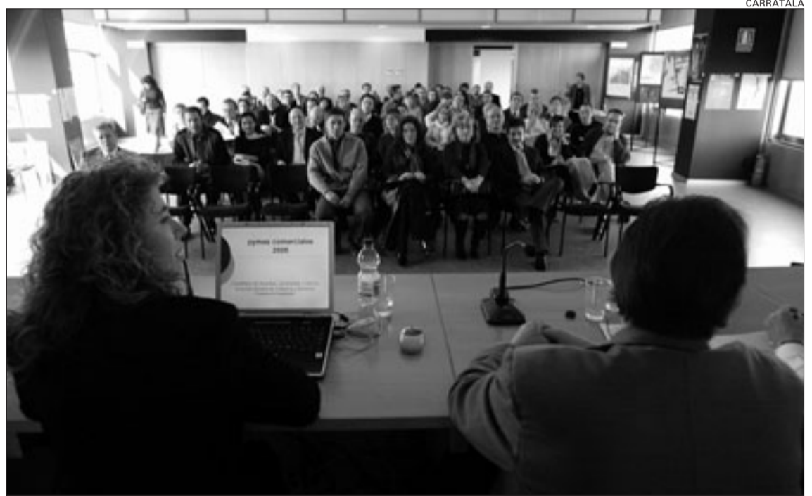
Un momento de la reunión del director general y la directora territorial de Comercio con las asociaciones