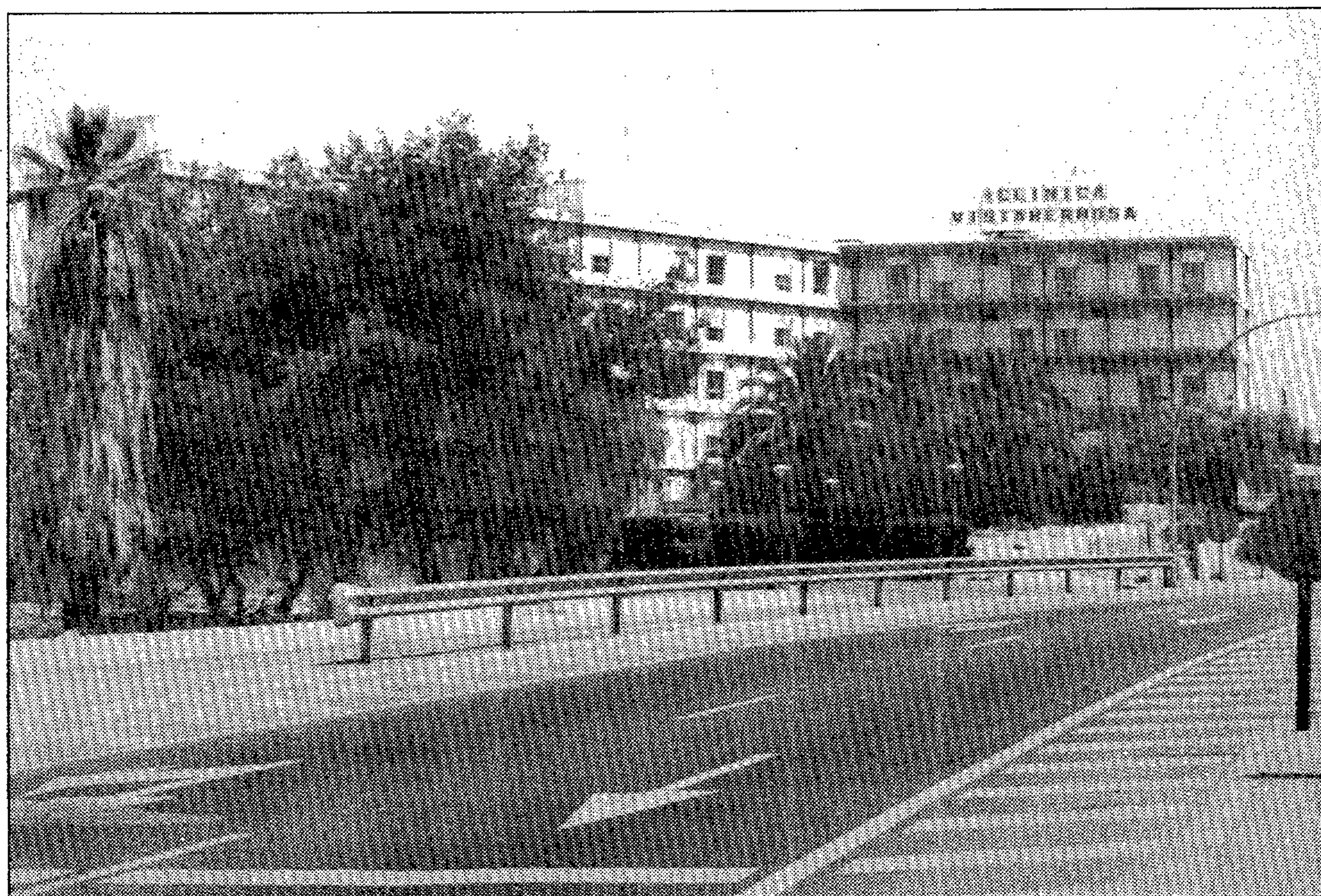
Las monjas dejan Vistahermosa

—Nosotros hemos pedido a las religiosas un tiempo prudencial para que abandonen la clínica hasta que repongamos la