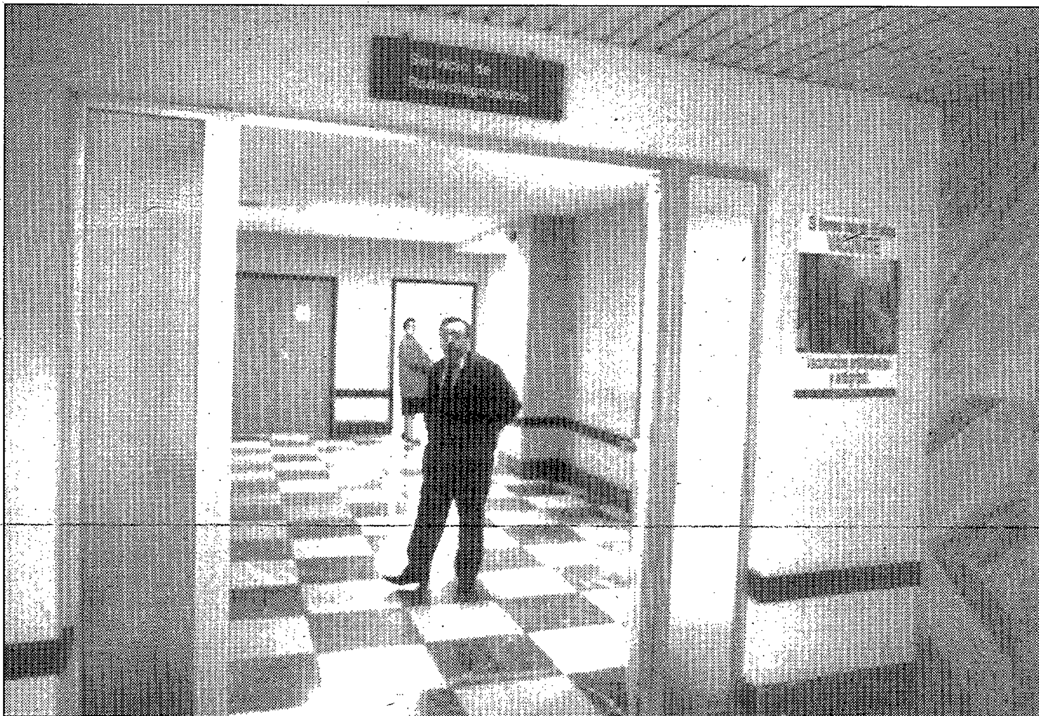
Entrada al servicio de Radiodiagnóstico del Hospital General en una imagen de archivo.

SAN JUAN. Sin embargo, este fin de semana tampoco ha funcionado el TAC del Hospital Universitario de San Juan, uno de los más modernos instalados en la provin-